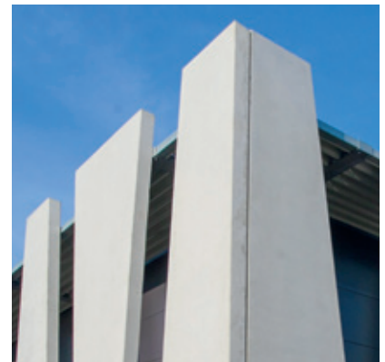
Übereckenschlüsse – eine individuelle und passgenaue Lösung.

Nach den intensiven und gründlichen Vorplanungen ging es dann im November 2017 an die Produktion. Zunächst entstanden 24 verschiedene Formen, die dann nacheinander für insgesamt 59 Bauteile ausgegossen wurden. Die Fassadenbauteile verfügen über Abmessungen von 1,50 bis 3,25 m Breite und 8,50 m Höhe. 3,8 m 3 Beton fasst eine Form im Durchschnitt. Insgesamt ergab das letztlich ein Volumen von 225 m 3 Beton, der eingesetzt wurde. In jedes einzelne Bauteil wurde