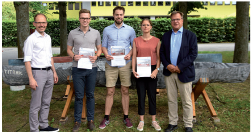
ifm TU Darmstadt

Über 20 Studierende hatten die Chance auf die Anerkennung der FDB für den technisch versierten und kreativen Umgang mit Betonfertigteilen in der Lehrveranstaltung Fertigteilkonstruktionen.