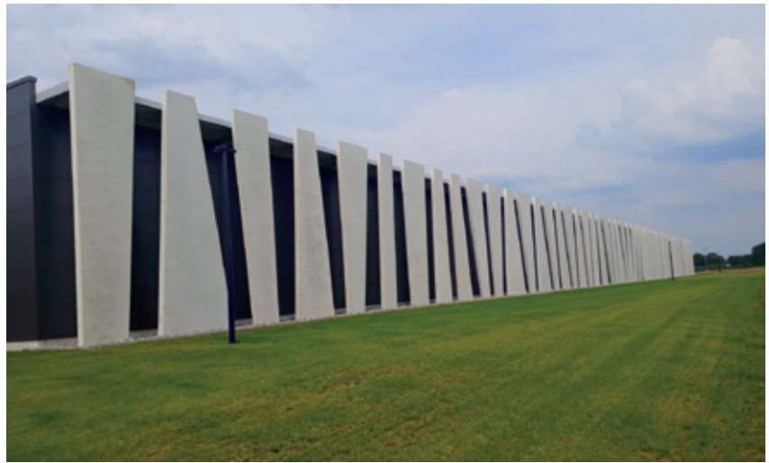
Die Fassade aus hochwertigen und sonderarchitektonischen Betonfertigteilen bietet ein beeindruckendes Bild.

Der Auftrag für Sicon Bau, die in ihrem Portfolio die Komponenten Stahl, Beton und Glas vereint, sah zudem vor, dass sich die einzelnen Betonteile nicht alle gleichen sollten. Für jedes sollte möglichst eine eigene Form hergestellt wer-