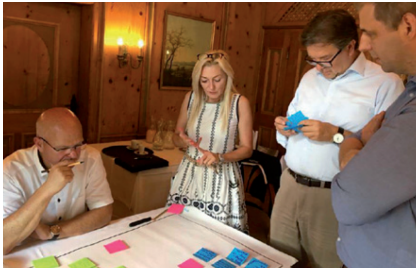
Unternehmens- und Verbandsvertreter im Workshop der Initiative Pro Keller.

Sowohl für die Zielgruppe Private Bauherren als auch für Entscheider in Bauämtern wurden neue Ausrichtungen und